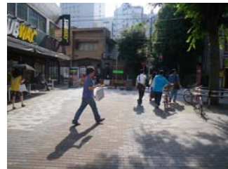
<解散場所 サブウェイ前の路地>