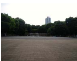
<集合場所 水の広場（新宿ナイアガラの滝前）>

※集合場所は変更ありませんが、パレードのルートは当日変更になる可能性があります。